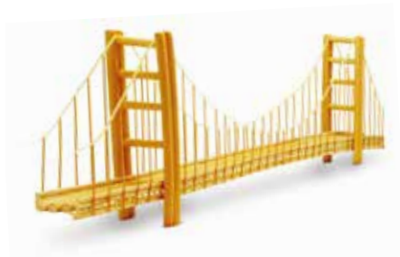
Golden Gate bridge (San Francisco - USA)